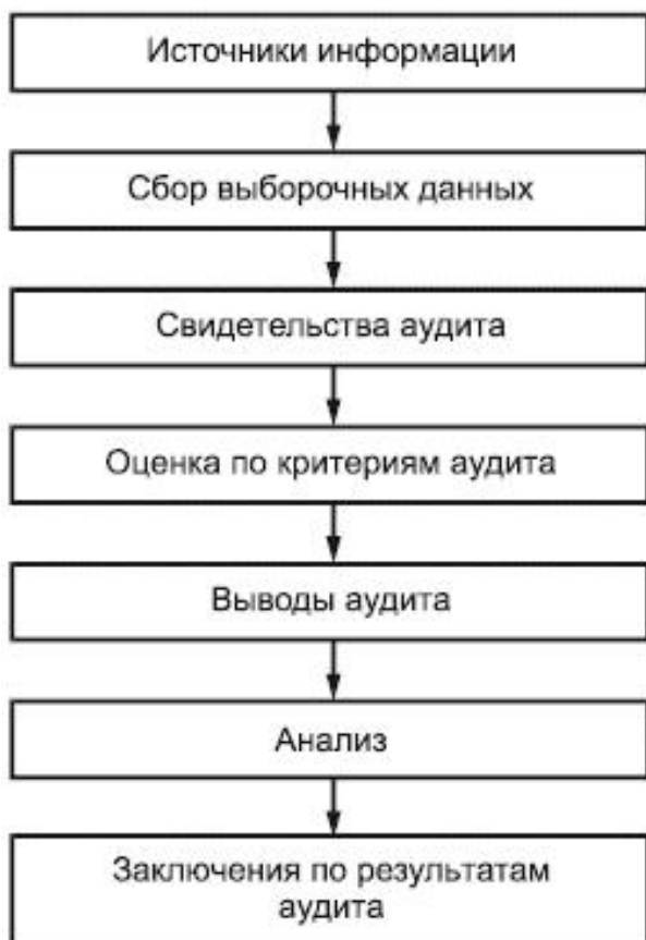
Рисунок 3 - Блок-схема процесса, начиная от сбора информации до получения заключений по результатам аудита